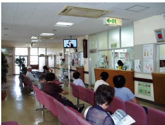
外来受付・待合ロビー