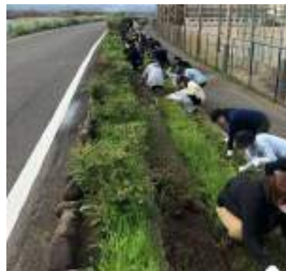
ボランティア作業 (あつまるくん(集患)WG)