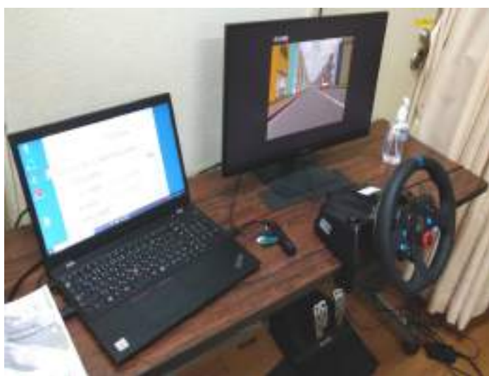
自動車運転シミュレーター