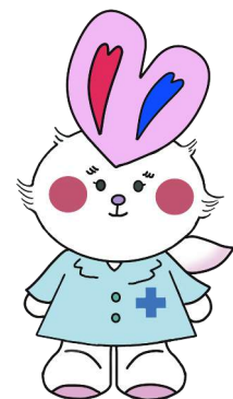
公式キャラクター「ずーみん」 (プロモーションWG)