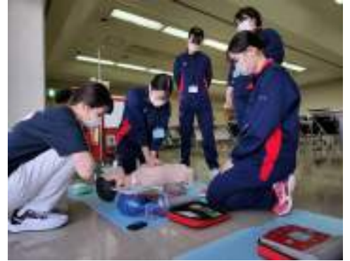
看護学生への看護セミナー （看護師募集・定着WG）

PTのリーダー・サブリーダーから受けた助言を参考に次回以降のWG活動に活かしていく。